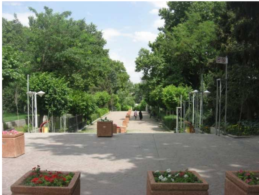
تصویر ۲- پارک نیاوران