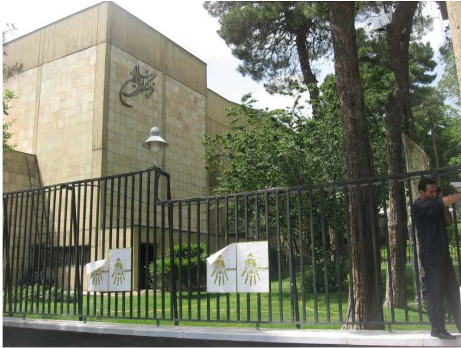
تصویر ۱- فرهنگسرای نیاوران