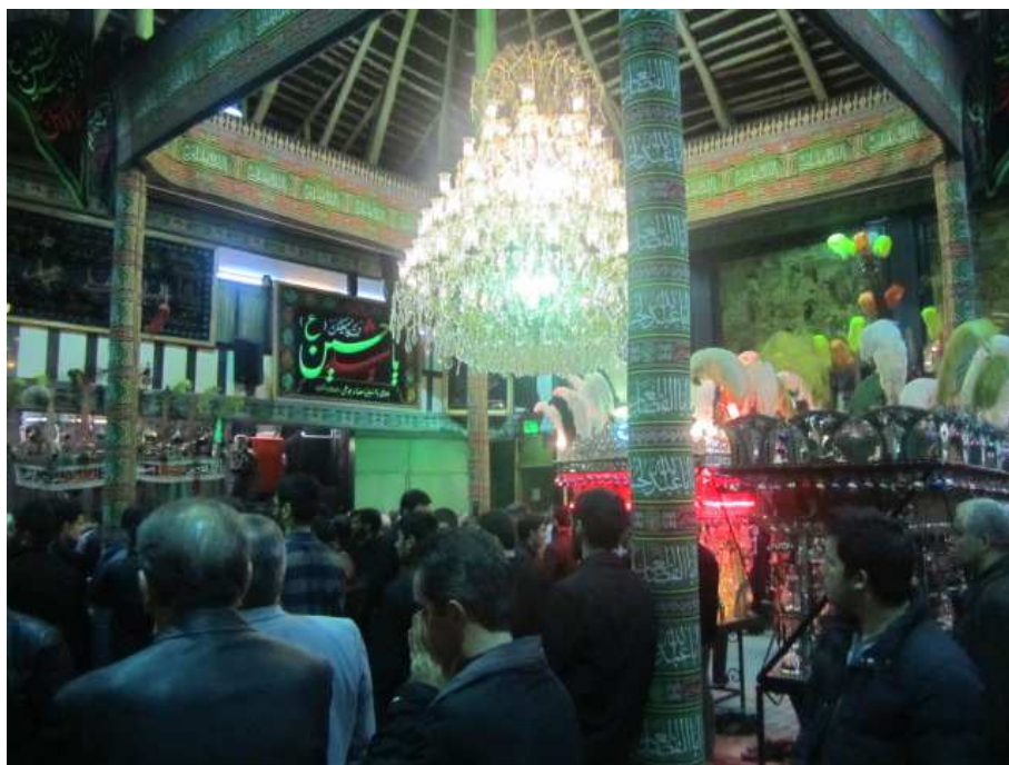
تصویر ۳- تکیه بزرگ حصاربوعلی (تکیه پایین)